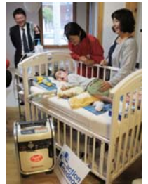
障害児が必要とする呼吸器を動かすための発電機を届けました